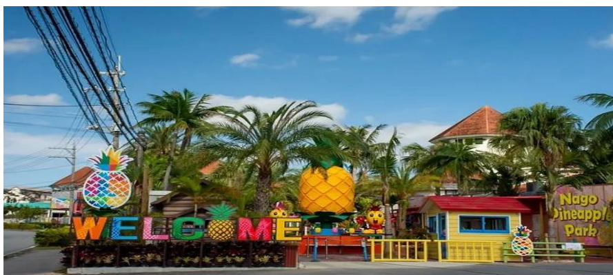
Nago Pineapple Park

是以古琉球歷史、傳統民俗、歌舞文化、工藝美食等為主題的主題公園。進入沖繩琉球村，就猶如時光倒流，回到了琉球古國。村內建有琉球各地的古老的民居房屋，部分是移建復原，這些民居逼真地再現了古琉球的一些著名世家的古住宅，如舊比嘉家住宅、舊島袋家住宅、舊花城家住宅、舊大城家住宅、舊平田家住宅、舊玉那霸家住宅、舊西石垣家住宅等，分布在園內的各處，展現了古琉球的真實生活場景，再現了以水牛為動力壓榨甘蔗的古老的砂糖生產作坊砂糖屋的場景，處處都可以感受到古琉球的氛圍。